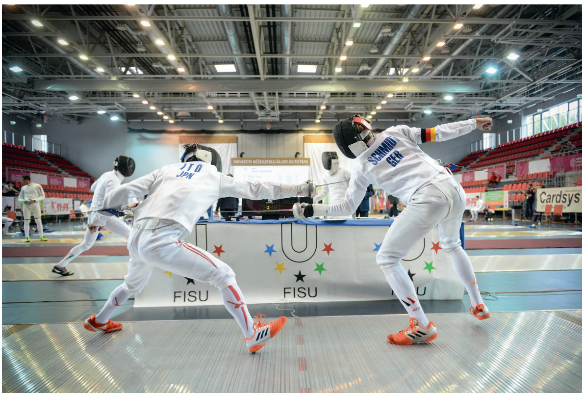
Egyetemi öttusa-világbajnokság 2017. július 3–8.