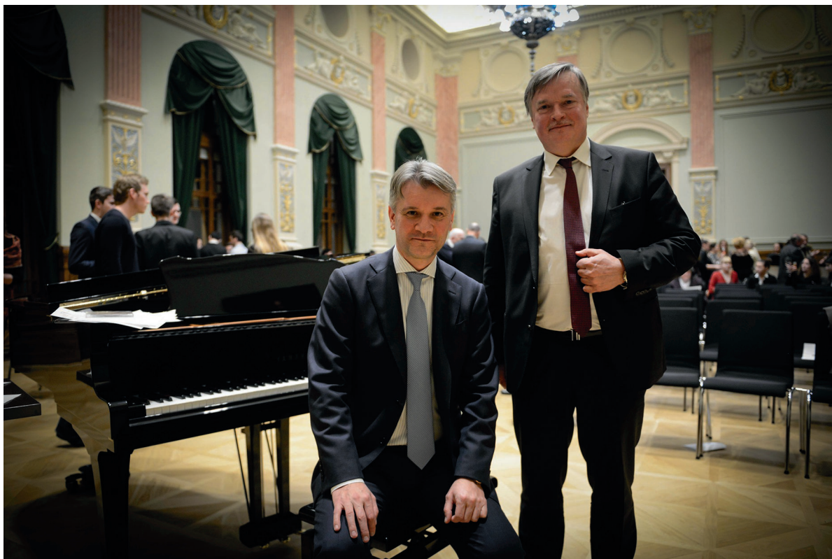
A Ludovika Zeneszalón első előadása 2018. február 28.