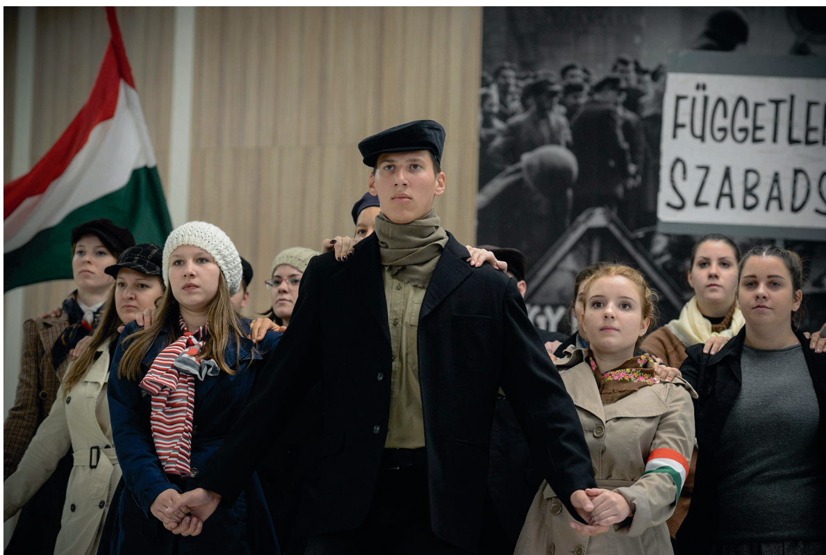
Ünnepi megemlékezés az 1956-os szabadságharc és forradalomról 2017. október 23.