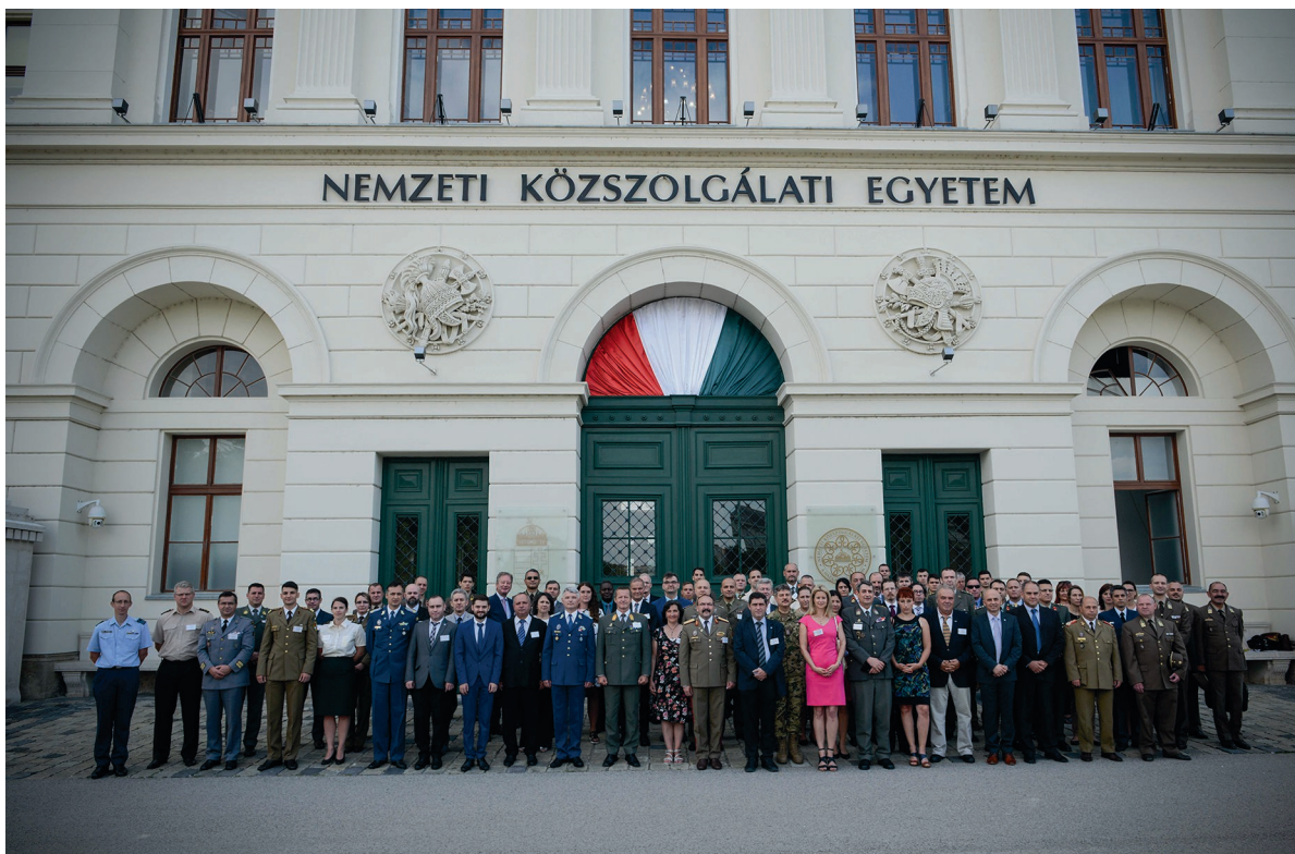
International Military Academic Forum 2018 2018. június 18–21.