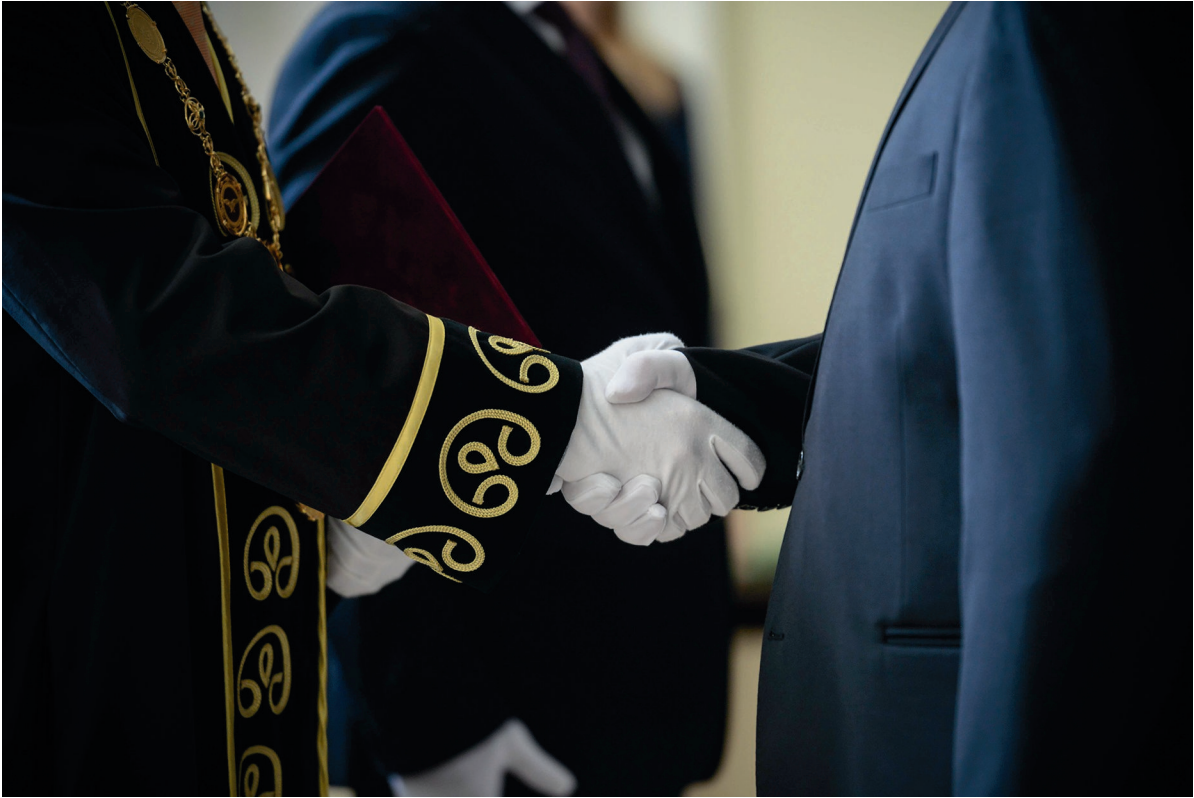
NBI oklevélátadó ünnepség 2018. július 5.