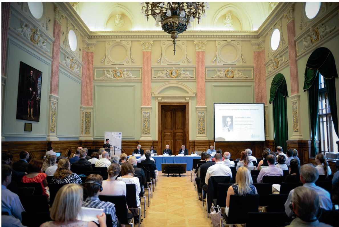
Climatters 2018, Országos Fenntarthatósági Szakmai Napok 2018. május 23–24.