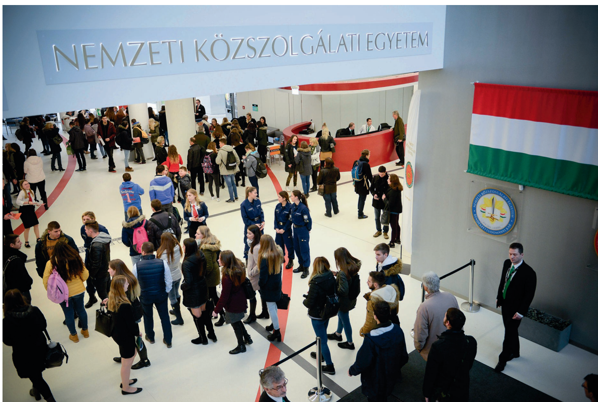
Nyílt nap 2017. november 24.