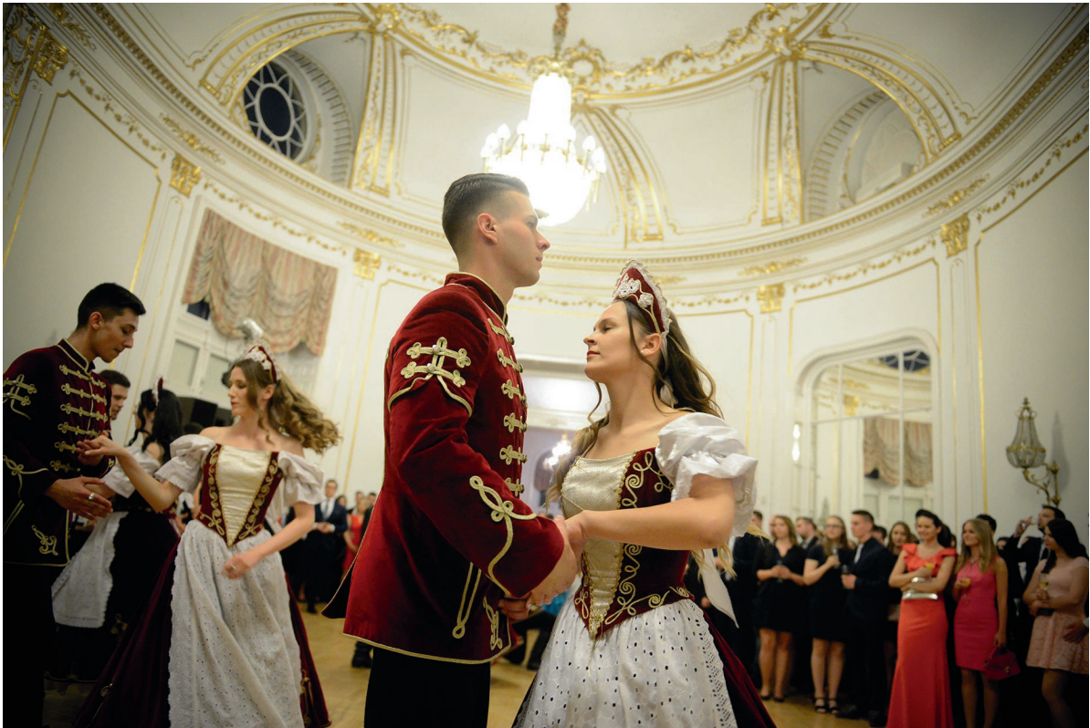
Gyűrűavató bál, Stefánia Palota 2018. május 3.