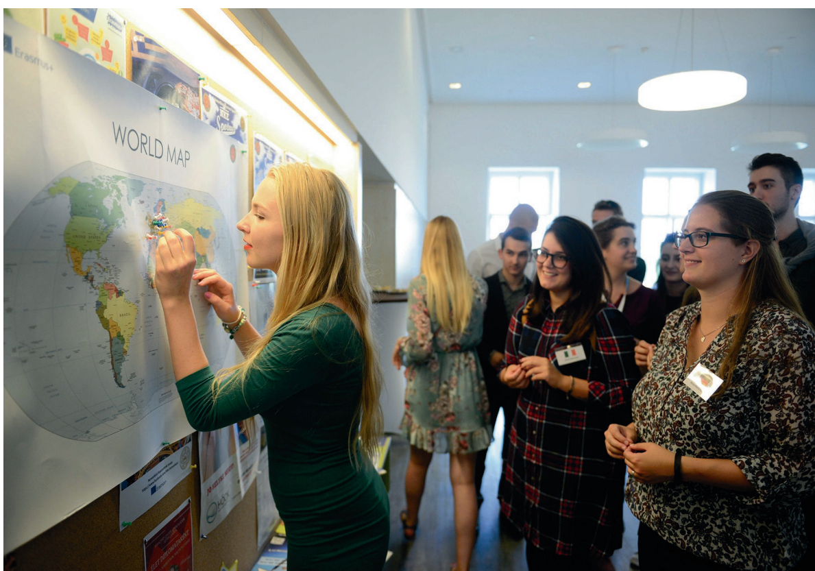
International Welcome Day 2017. szeptember 26.