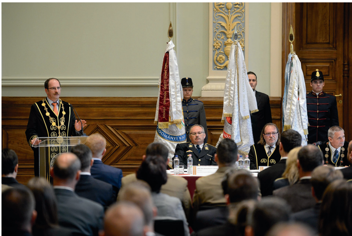
Doktori tanévnyitó ünnepség 2017. szeptember 18.