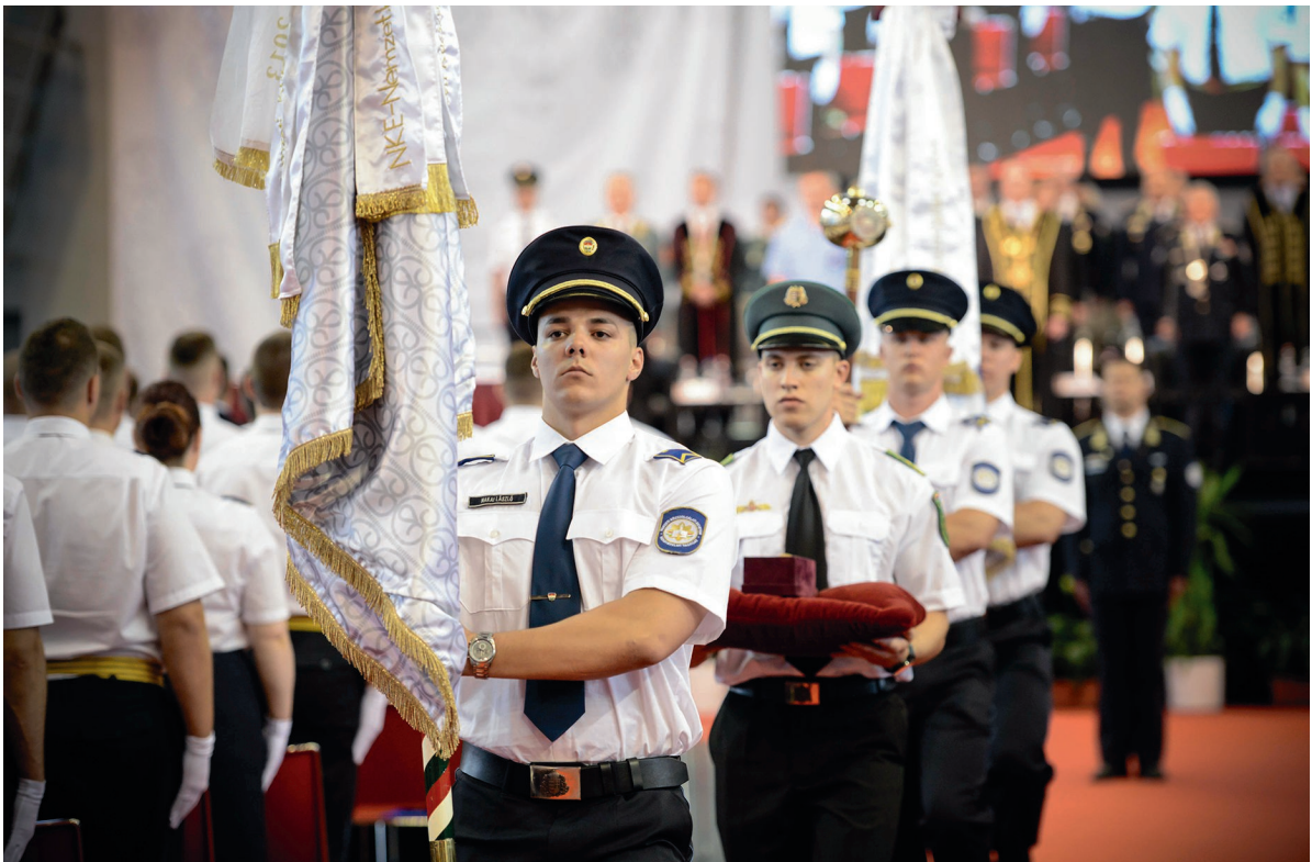
RTK oklevélátadó ünnepség 2018. június 28.