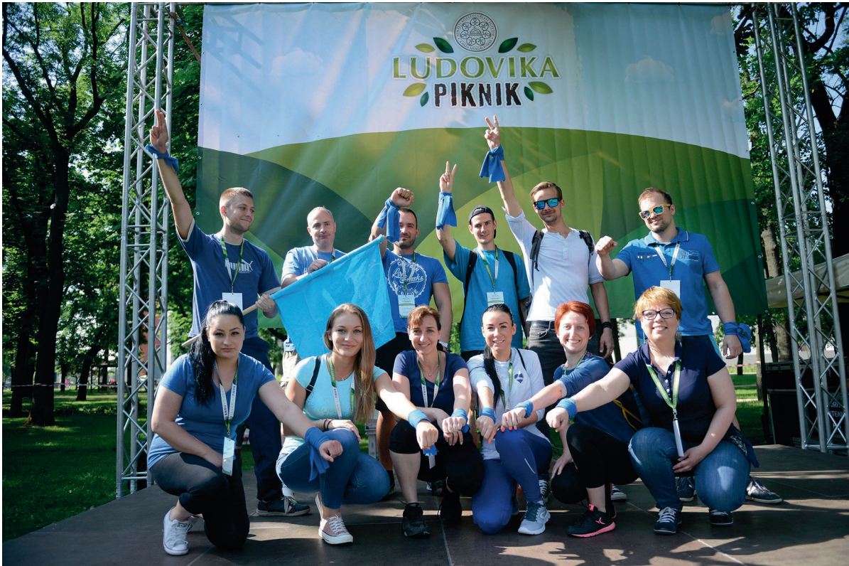
Ludovika Piknik 2018. május 11.