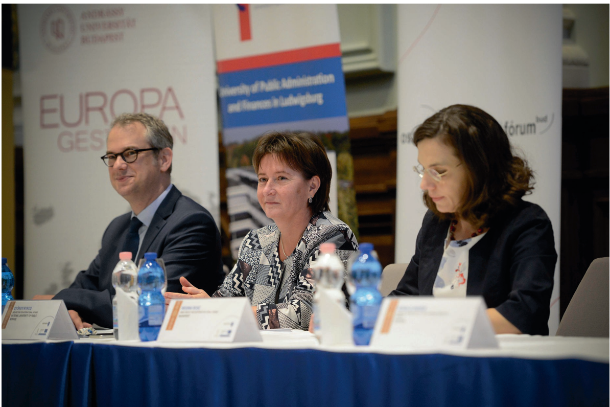
CEEEGOV Days 2018 2018. május 3-4.