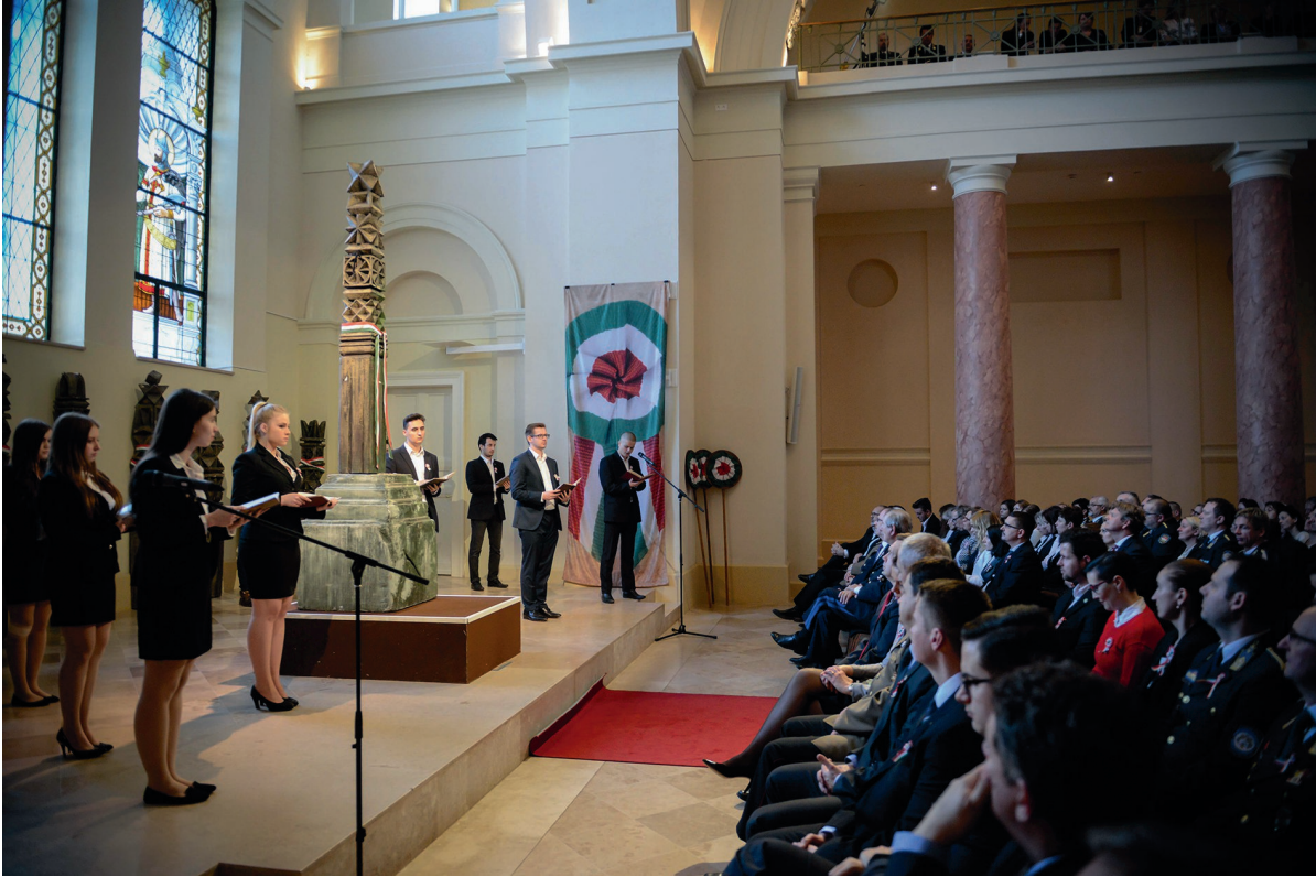
Március 15-i ünnepi megemlékezés 2018. március 14.