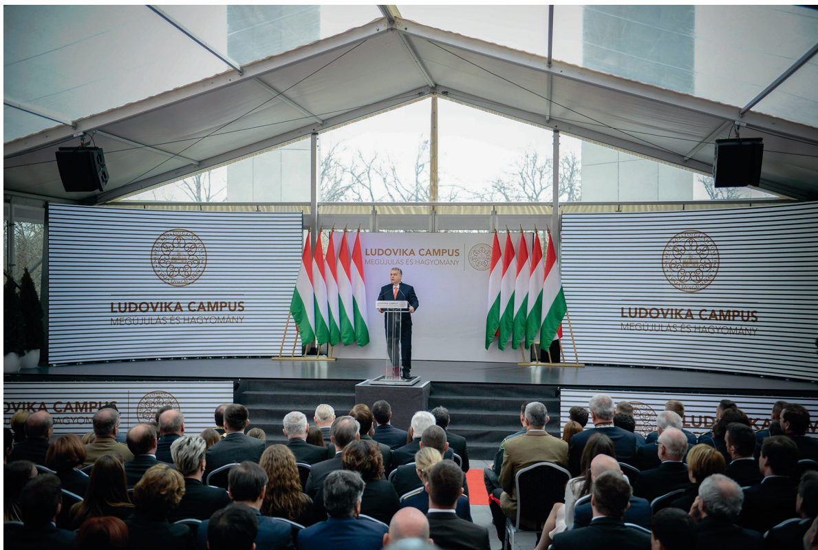
A Ludovika Campus átadóünnepsége 2018. április 4.