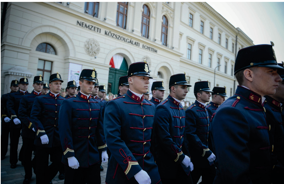
100 Napos Ünnepség, Ludovika Fesztivál 2018. május 12.