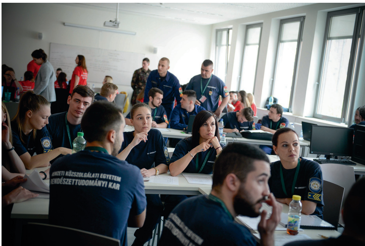
Integrált Védelem 2018 – Közös Közszolgálati Gyakorlat 2018. április 23-24.