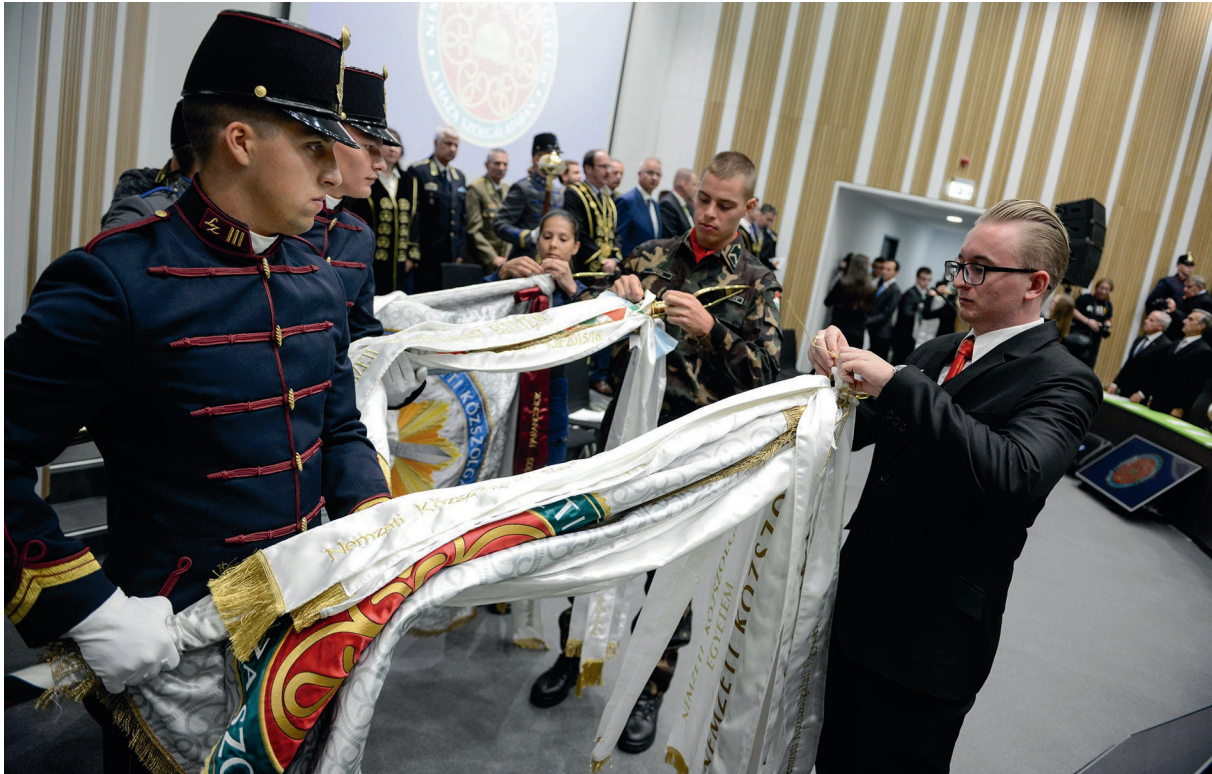
Egyetemi tanévnyitó ünnepség 2017. szeptember 7.