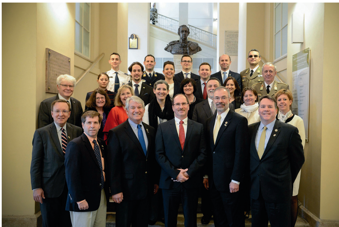
Amerikai delegáció érkezése 2018. március 10.