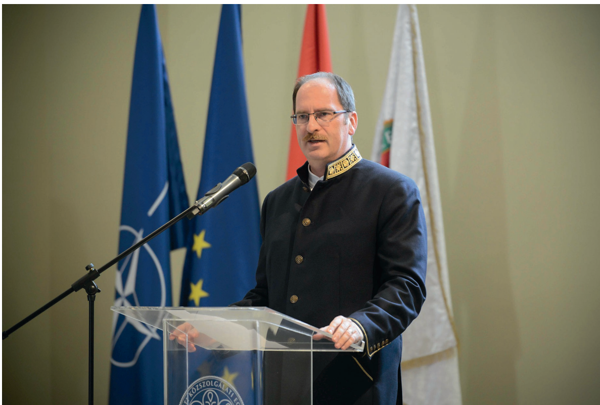
Központi tanévzáró ünnepség 2018. július 13.