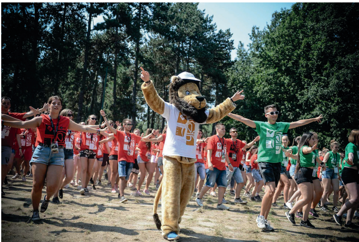
Gólyatábor 2018. augusztus 8–11.