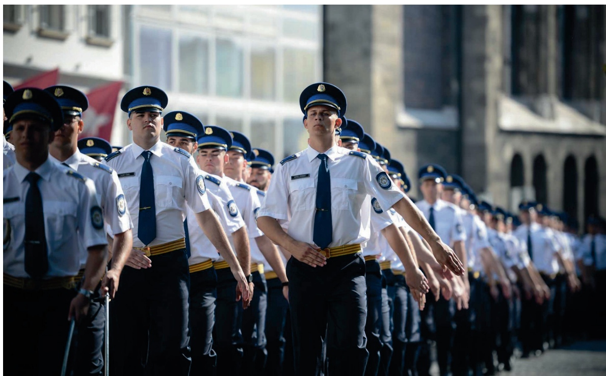
RTK ünnepélyes tisztavatás NBI oklevélátadó ünnepség 2018. június 30.