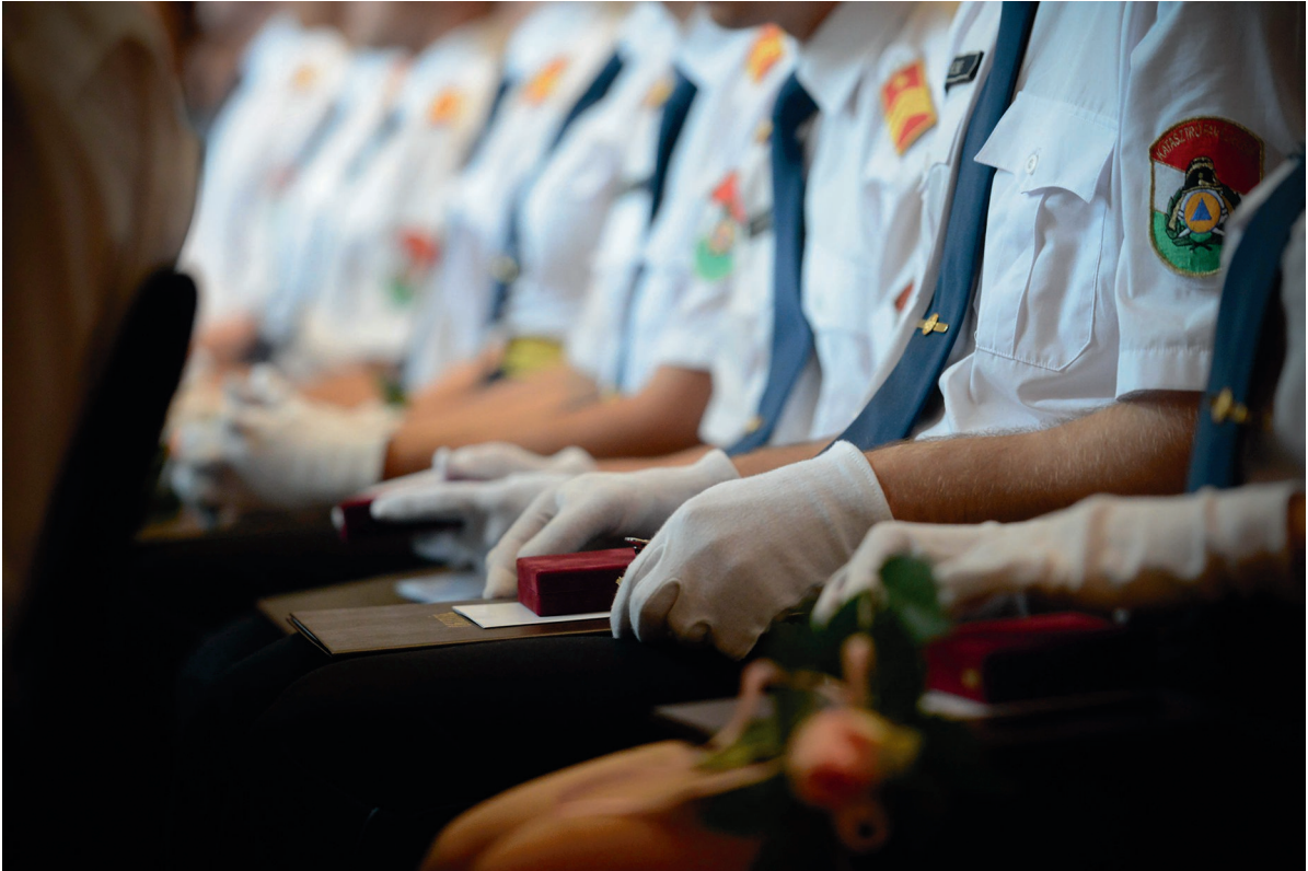
KVI oklevélátadó ünnepség 2018. június 27.