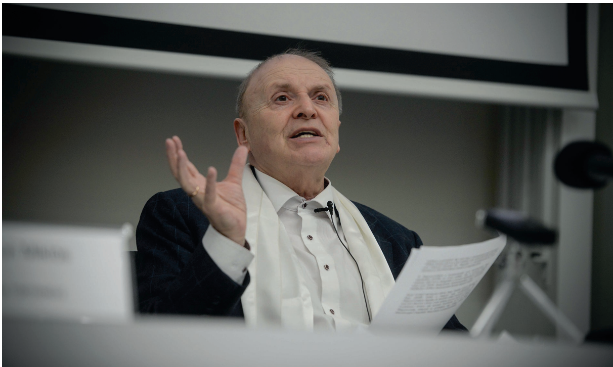
A Ludovika Szabadegyetem 2017/2018. őszi szemeszterének első előadása 2017. szeptember 11.