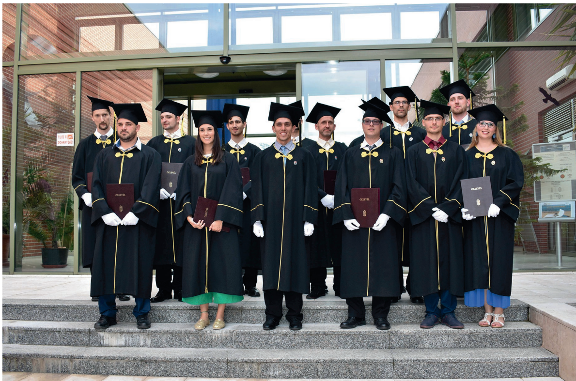
VTK oklevélátadó ünnepség, Baja 2018. június 28.