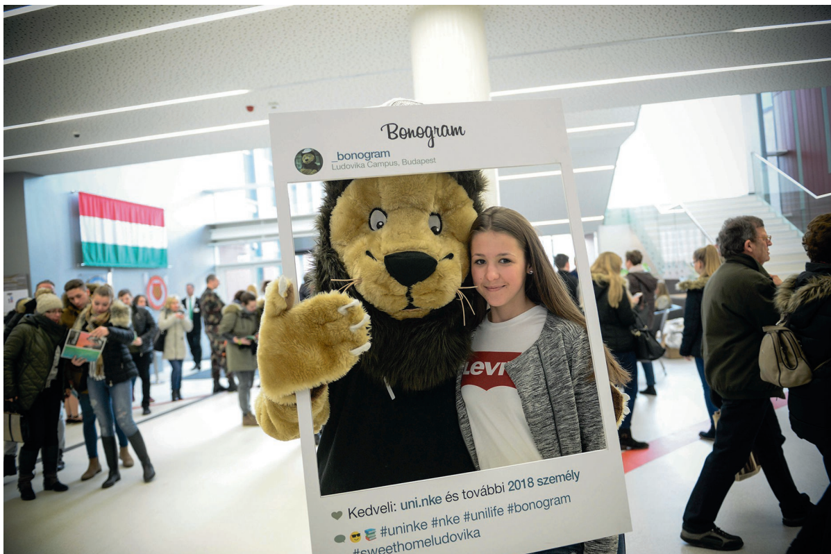
NKE nyílt nap 2018. január 27.