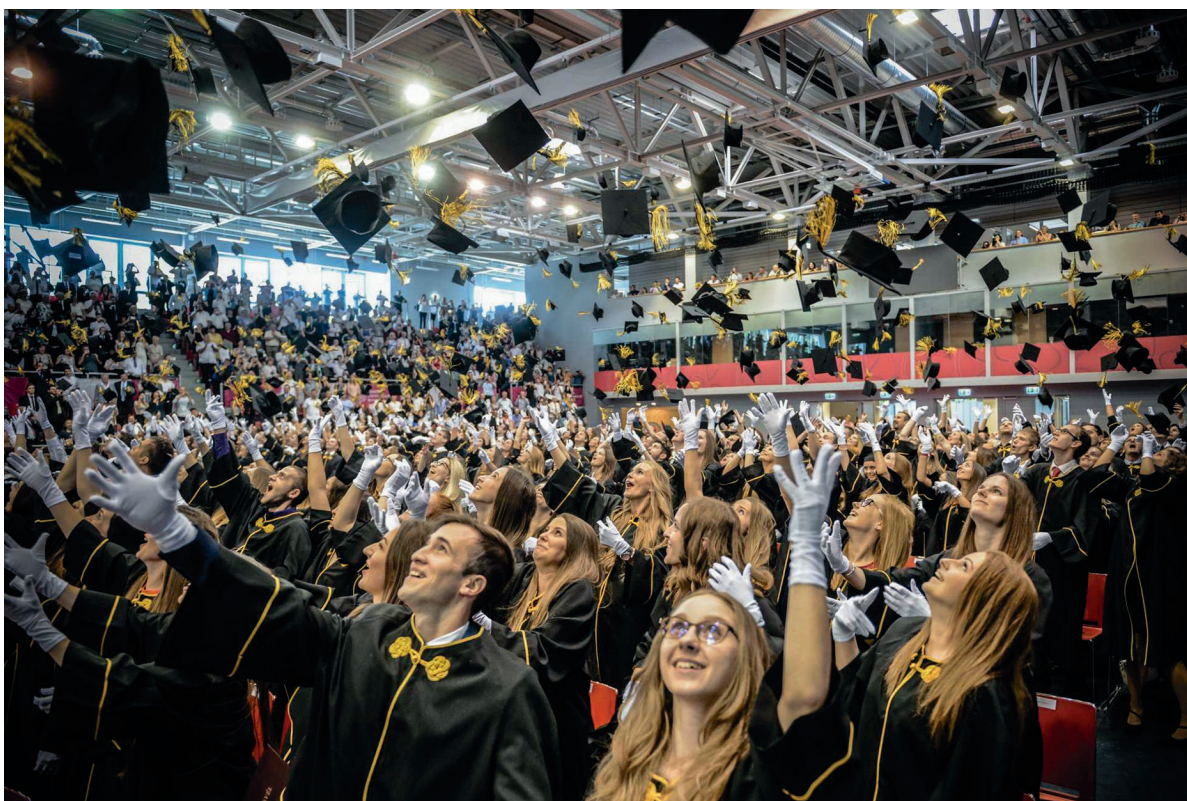
ÁKK oklevélátadó ünnepség 2018. július 14.