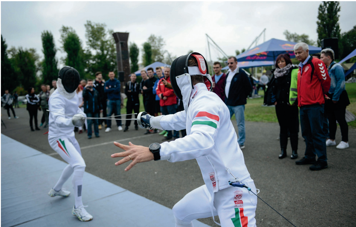
Egyetemi sportnap Rendészeti Szervek Kiképző Központja, Vágóhíd utcai sporttelep 2017. szeptember 20.