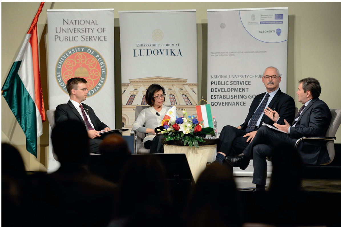
A Ludovika Nagyköveti Fórum első előadása 2017. szeptember 26.