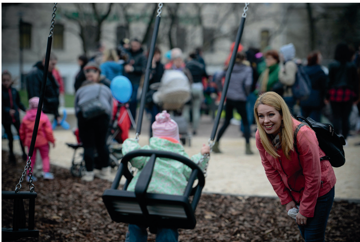
Orczy-park, családi nap 2018. április 7.