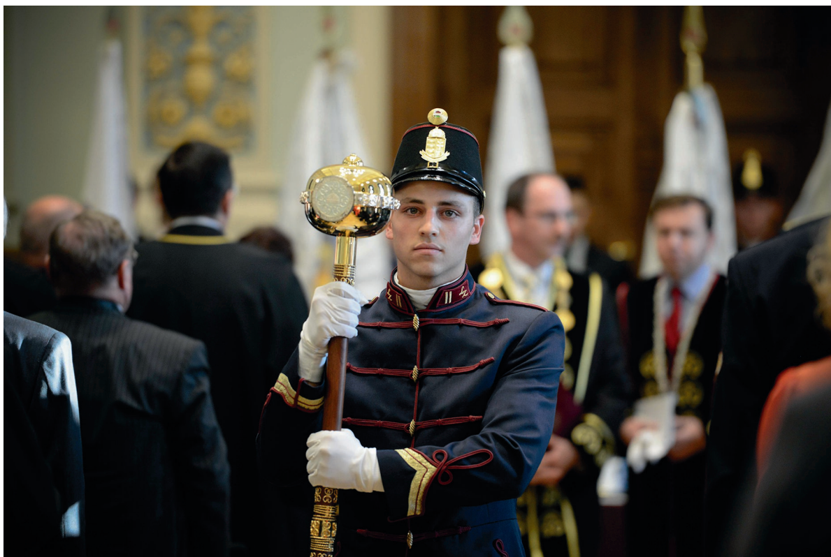
A Szenátus ünnepi ülése 2017. november 7.