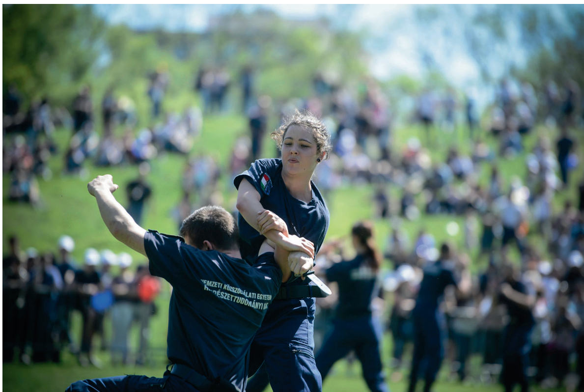
Rendőrnapi ünnepség 2018. április 20.