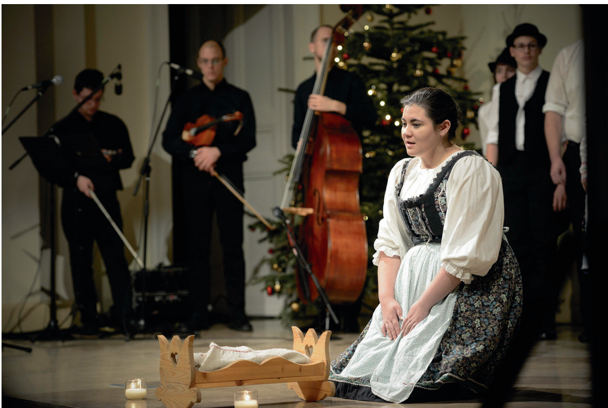
Központi karácsonyi ünnepség 2017. december 21.