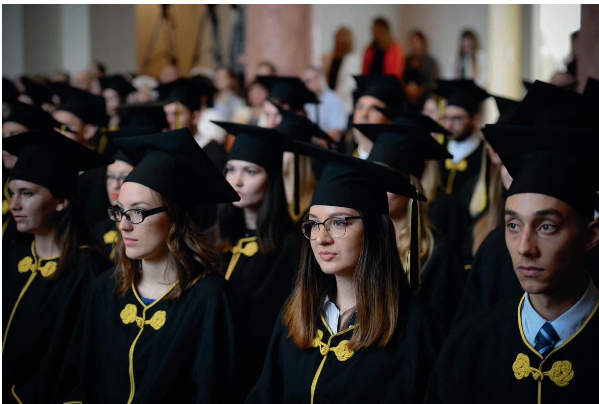
NETK oklevélátadó ünnepség 2018. július 7.