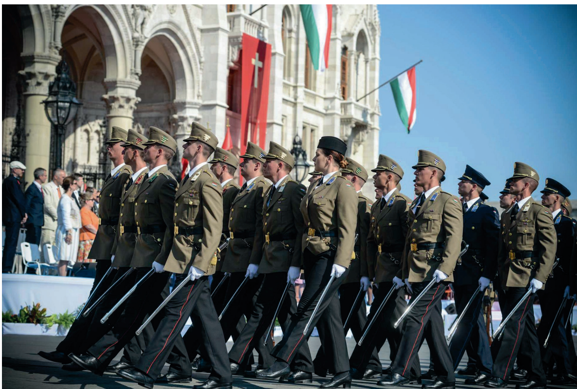
Honvédtisztavatás, Kossuth tér 2018. augusztus 20.