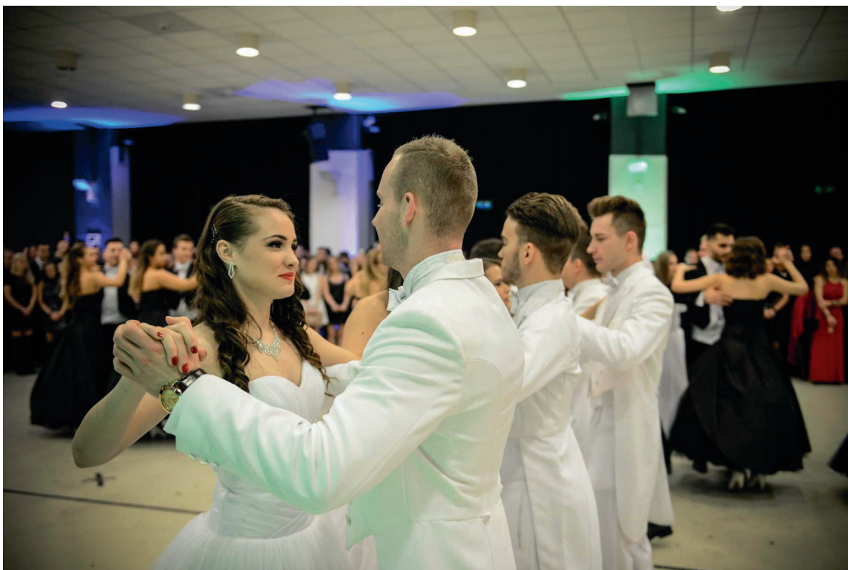
Gólyabál 2017. november 29.