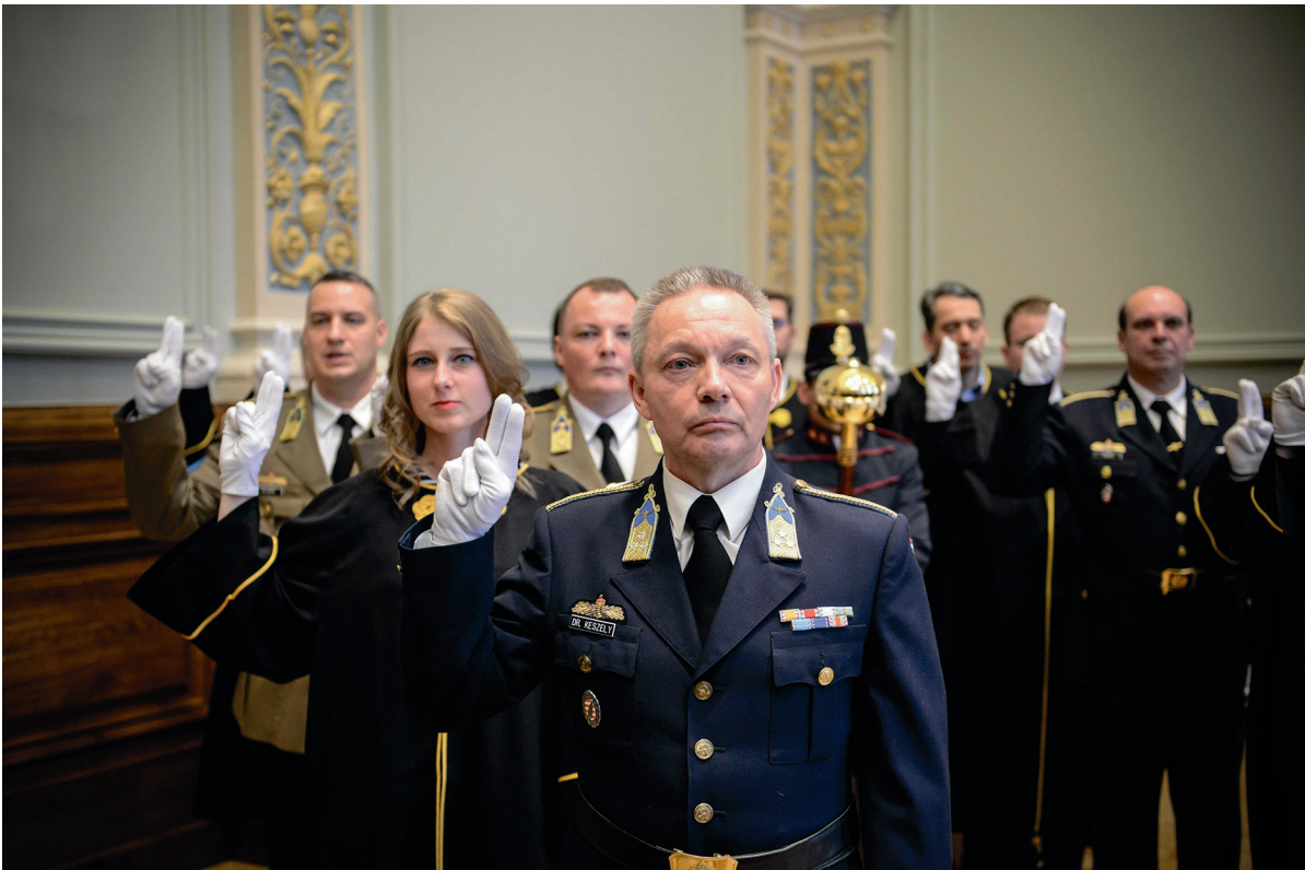
Egyetem Napja, ünnepi Szenátus, doktoravatás 2018. március 28.