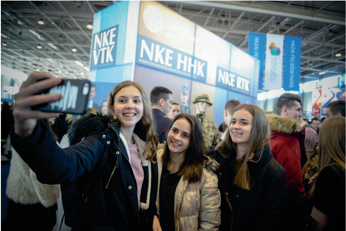
Educatio Kiállítás 2018. január 18–20.