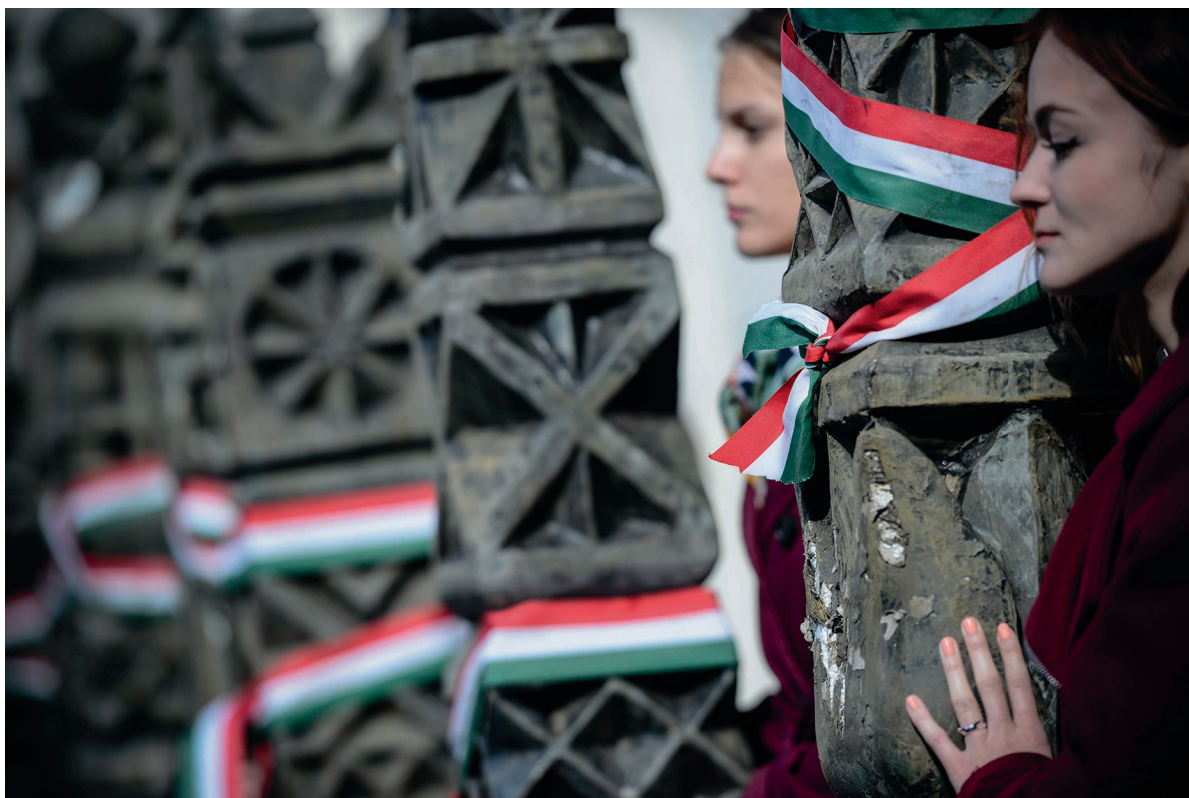
Megemlékezés az aradi vértanúkról 2017. október 6.