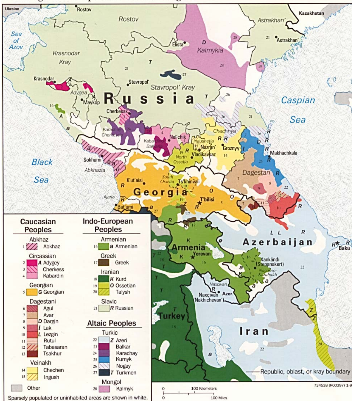
3. sz. ábra