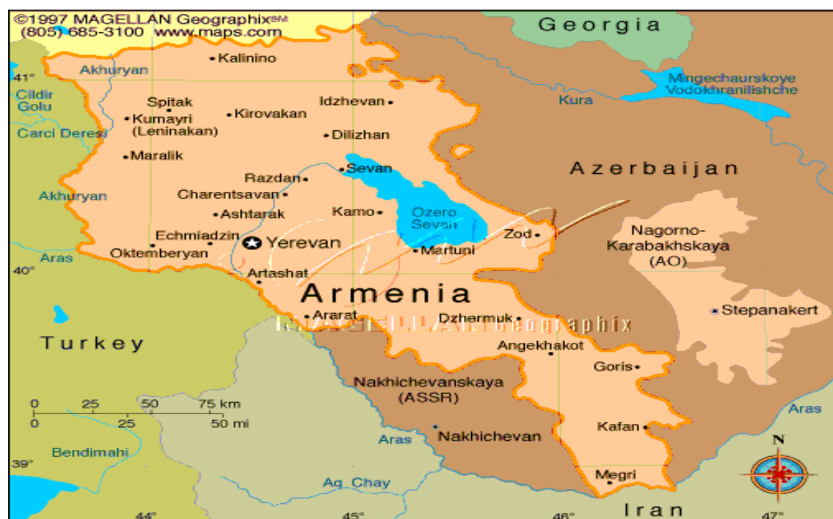
6. sz. ábra