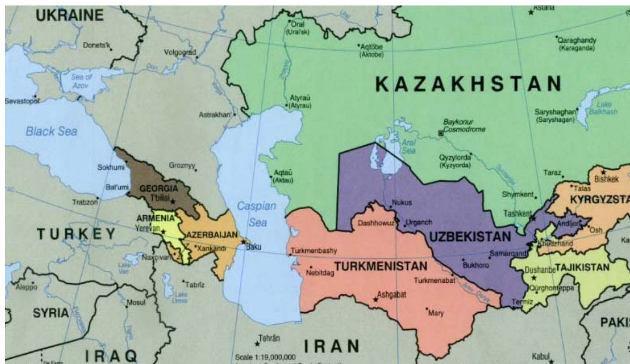
2. sz. ábra

Égészen más eset a Fekete—tenger keleti partvidéke. A geopolitikai szempontból összefoglaló néven kaukázusi régióknak nevezett területhez tartoznak Oroszországi területek, Grúzia, valamint földrajzi értelemben nem ide, hanem a Kaszpi-tengeri területhez tartozó országok, mint Azerbajdzsán és Örményország is. Ez utóbbi három ország, valamint az Oroszországhoz tartozó Csecsenföld azonban az egész régióra kiterjedő konfliktusok forrásai, beleértve a térség olajvagyonáért folytatott helyi, illetve nagyhatalmi vetélkedést. Így a fekete tengeri régió rendkívül összetett viszonyainak megértéséhez feltétlenül vizsgálni kell ezen országok szerepét is. 20 Ugyanígy nem hagyható figyelmen kívül a térség országainak politikai játszmáiban Moldova sorsa, helyzete sem.